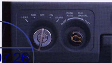
エンジン回転数調整スイッチ

AUTOを選択すると、エンジン冷却水温に応じて回転数が自動的にアップ/ダウンして、クレーン作業時のオーバーヒートを抑えます。履機運転などにはMANUAL選択で、任意の回転数をセッティングすることができます。